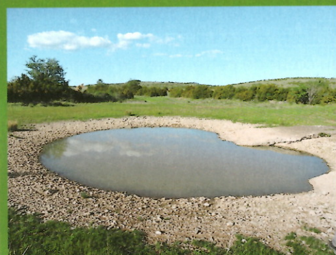
Lavogne, Le Lagens, Lanuéjols

- Les mares bâchées peuvent être propices aux amphibiens également.